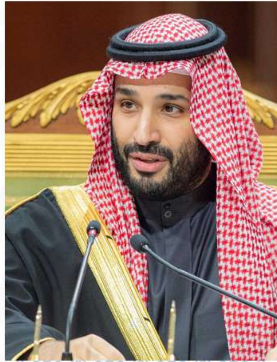
صاحب السمو الملكي

الأمير محمد بن سلمان بن عبدالعزيز آل سعود